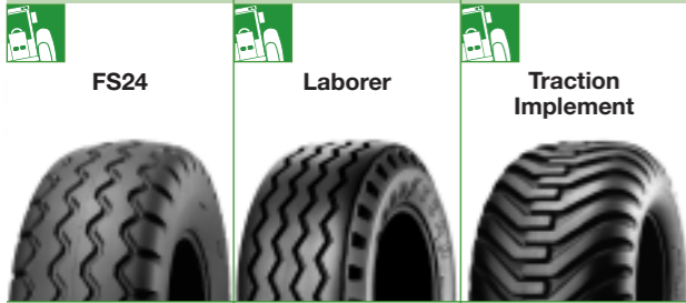
Radial para desgaste correcto y durabilidad Aplicaciones específicas Para una máxima estabilidad