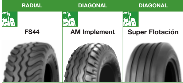
Neumático radial para desgaste correcto Movilidad en campo y carretera Preservación del suelo